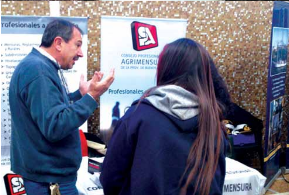
Educación Técnica N° 1 “General Savio” de la localidad de Saladillo.