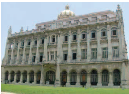
Foto 2 Fachada Oeste