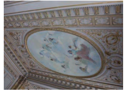
Foto 7 Óleo de Romañach

Construido con cimentación aislada de diseño variable según el área. La estructura es de pórticos de columnas, vigas, entresijos y cubierta de hormigón armado fundido in situ, con estructuras metálicas en algunas partes del cuarto piso y en la cúpula. Los muros exteriores están contruidos con sillares de capellanía, perfectamente cortados y sin revestir. Lo adornan terminaciones de mármol, carpintería metálica y de madera, metales preciosos y un amplio patrimonio artístico que contiene obras de Armando García Menocal y Leopoldo Romañach entre otros renombrados pintores de la época.