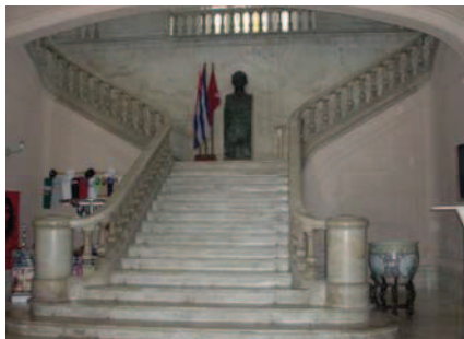
Foto 3 Escalera principal