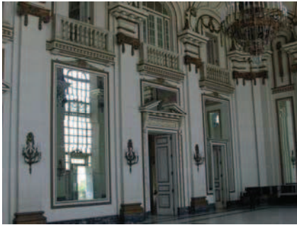
Foto 5 Salón de los espejos