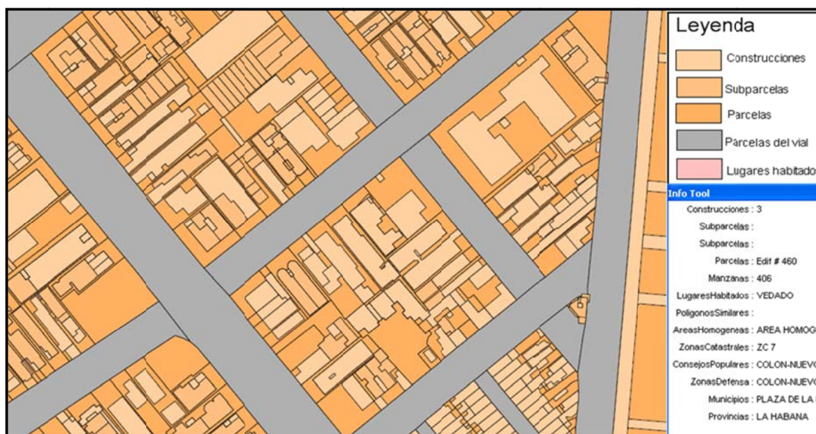
Figura 3. Fragmento de la cartografía catastral urbana del municipio Plaza Revolución.

Hasta la fecha, la Empresa GEOCUBA Geodesia, ha completado la cartografía catastral urbana de 137.47 hectáreas, correspondientes a parte de los consejos populares de Colón y Carmelo, este valor es inferior a lo previsto para la etapa actual de los trabajos, sin embargo en lo que va de experimento ya se implementó en el SI un número de manzanas mucho mayor a las que existían desde el año 2006, cuando comenzó el Catastro Urbano.