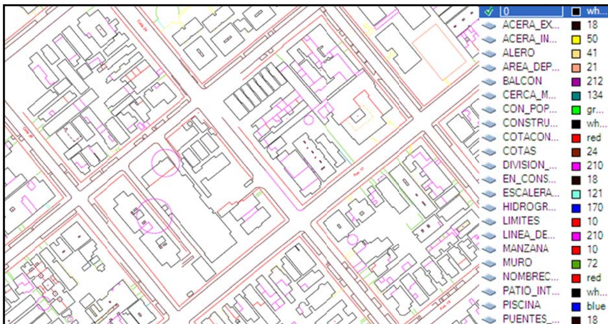
Figura 2. Fragmento del original fotogramétrico catastral del municipio Plaza Revolución.

Las características de la zona de los trabajos influyeron directamente en el nivel de completamiento del original restituido, ya que la alta densidad de edificios, muchos de ellos altos y la presencia de vegetación arbolada en parterres y patios, provocó gran cantidad de elementos ocultos por sombras en la imagen, disminuyendo la posibilidad de representar elementos de gran interés catastral como los límites de manzanas, parcelas y construcciones.